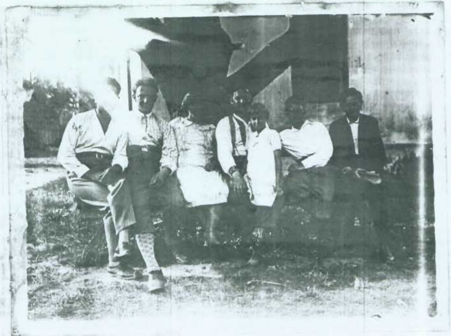
Директор и временный зборъ сельских клас.